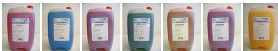
Hindbær Blue Ice Filur Grøn Sport Cola Jordbær Ananas